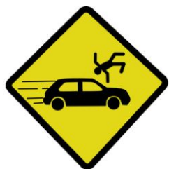
Nombre d'accidents par mois

Le cumul des tués enregistre une baisse de 23 tués représentant une baisse de 14 % sur l'année par rapport à la moyenne et de 43 tués par rapport au cumul sur 12 mois constaté en janvier 2023.